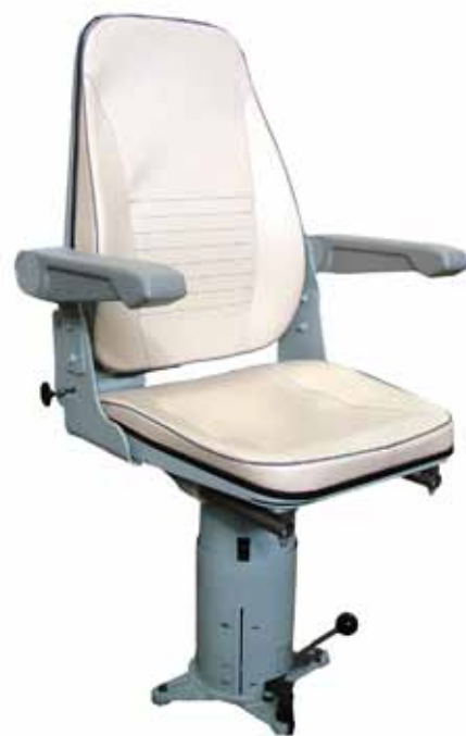
Рис. 5. Кресло машиниста КЛ-7500М.0-02У с уменьшенными габаритами по ширине

Кресла машиниста КЛ-7500М.0-02 устанавливаются на различных подвижной состав: ВЛ85, 2ТЭ116У, 2ТЭ116УД, 3ТЭ116У, 2ТЭ116УД, 3ТЭ116У, ТЭМ18В, ТЭМ18Д, ТЭМ18ДМ, ТЭМ7А, ТЭП70БС, ТЭП70У, ЭП2К, Э5К, ЭП1, 2ЭС4К, МКТ-1П, КШ-971, КШ-1471, ВПРС-03 и др. Кресла машиниста КЛ-7500М.0-02У, имеющие уменьшенные габариты по ширине, предназначены для электровозов ВЛ10, ВЛ10У, ВЛ11, ВЛ80.