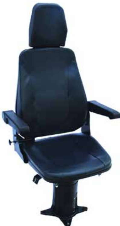
Рис. 4. Кресло машиниста КЛ-7500М.0-02-01 с подголовником