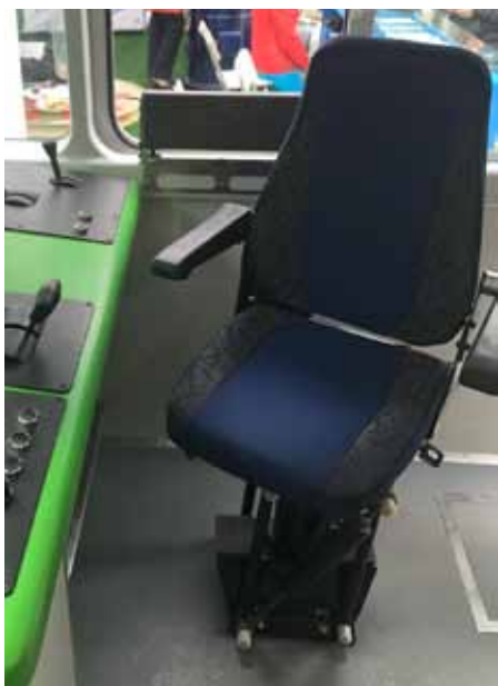
Рис. 1. Кресло машиниста КЛ-7500М.0-02У на подставке параллелограмм ПП.27.Т-0 в кабине производства ЗАО «МЫС»

2001 — 2005 гг.». В соответствии с этой программой специалисты ПКБ Департамента локомотивного хозяйства ОАО «РЖД» разработали проекты установки кресел КЛ-7500-0 на уже эксплуатируемые локомотивы и моторвагонный подвижной состав при проведении капитальных ремонтов.