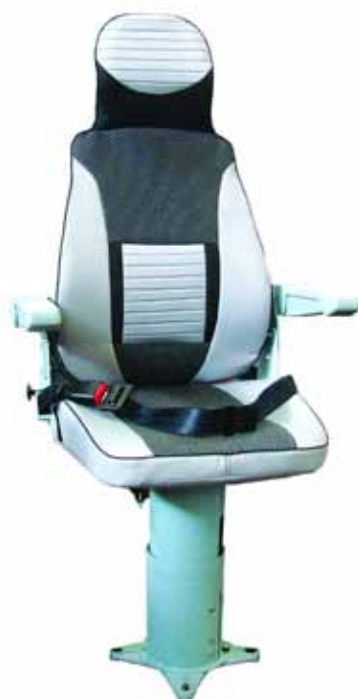
Рис. 3. Кресло машиниста КЛ-7500М.0-02-01 с двухточечным статическим поясным ремнем безопасности