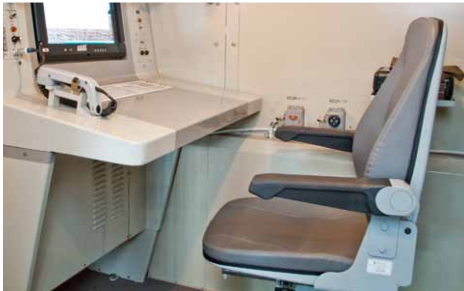
Рис. 6. Кресло КЛ-7500М на колесной технике

Предприятие «АВИТЕК» не ограничивается производством кресел для машинистов локомотивов. Его специалисты разрабатывают также пассажирские кресла 3-го класса, которые предназначены для оборудова-