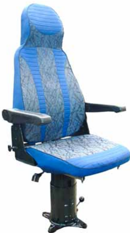
Рис. 2. Кресло машиниста КЛ-7500М.0-02-01 в тканевом чехле